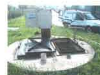
SERWIS I MONITORING